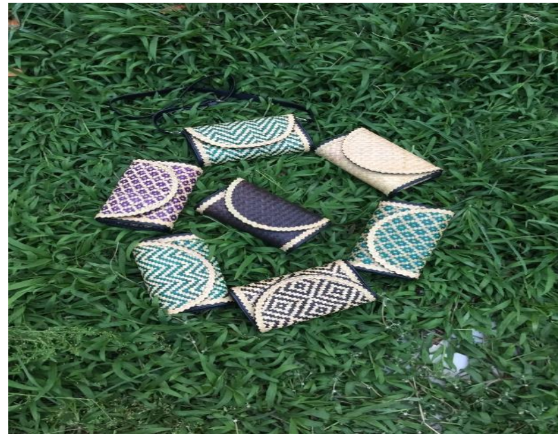
Hình ảnh sản phẩm từ cây cỏ bàng