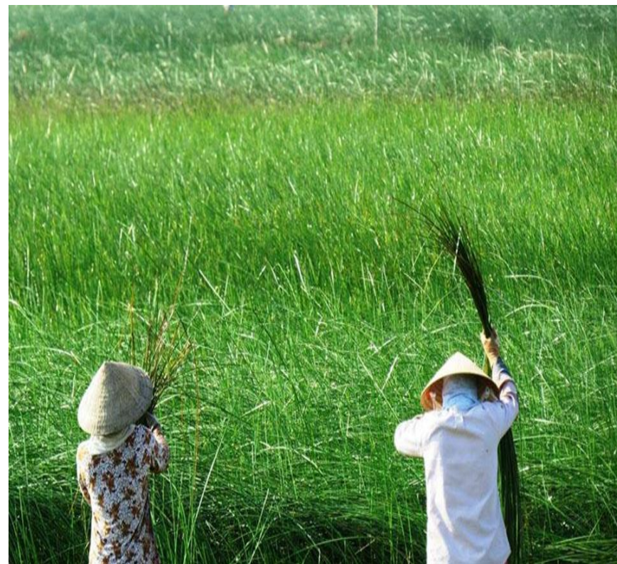
Hình ảnh cây cỏ bàng