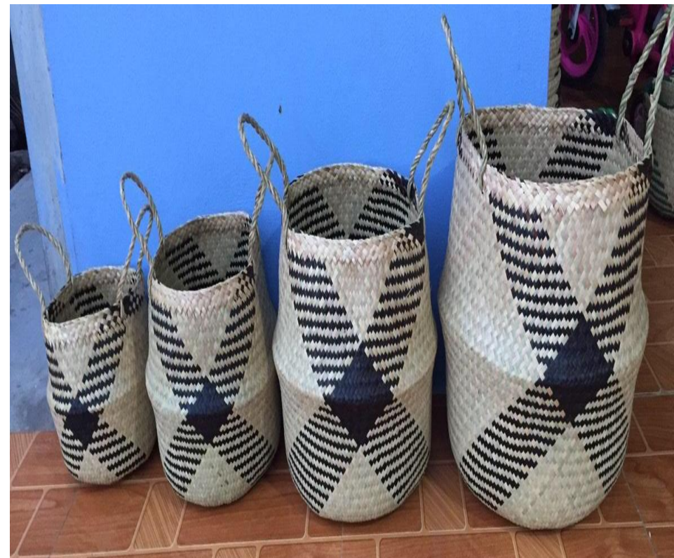
Hình ảnh sản phẩm từ cây cỏ bàng