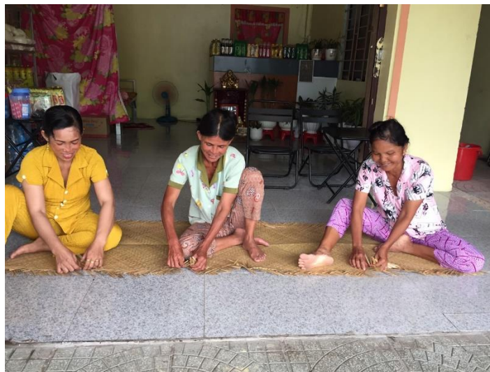
Người thợ đan cỏ bàng làng nghề Thi Dền ở ấp Trà Phô, Phú Mỹ.